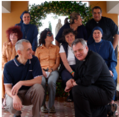
ESERCIZI SPIRITUALI IGNAZIANI 4-13 giugno 2009