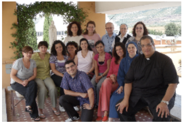
MINIMESE IGNAZIANO 3-19 agosto 2009

Carissimi Amici & Amiche di Casa Lanteri , inizio a scrivere questo editoriale mentre siamo al nono giorno di Esercizi Spirituali del cosiddetto Minimese ignaziano . L'estate sta volando via e stiamo per riaprire le porte di Casa Lanteri alle attività ordinarie che inizieranno sabato 19 settembre con la Giornata dell'Adorazione Silenziosa, l'incontro del cammino del secondo anno degli EVO, e la s. Messa di inizio delle attività e il momento consueto di fraternità che seguirà ad essa.